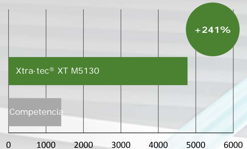
Comparación: velocidad de avance (mm/min)