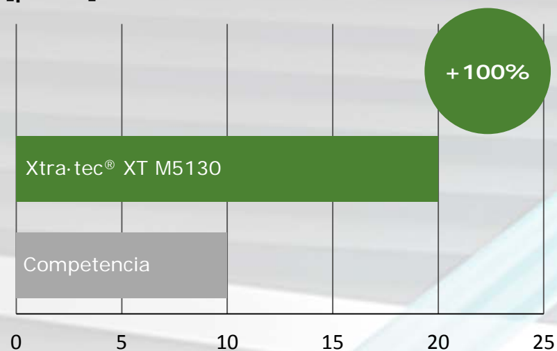
Comparación de producción durante la vida útil [piezas]