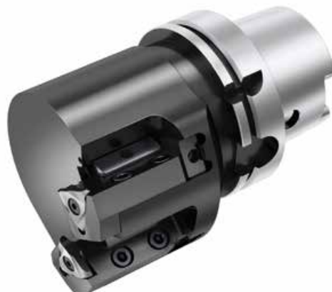
瓦尔特 (Walter) 插补车刀

进行插补车时，通过两个(或三个)线性轴的圆周运动实现切削速度。主轴以相同的角速度转动，从而使刀刃始终能切入。这样就能在加工中心上执行车削操作。